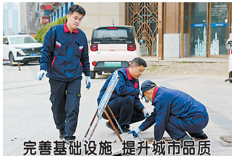
完善基础设施 提升城市品质

此次活动将传统节日文化与便民服务有机结合,既弘扬了中华优秀传统文化,又精准对接了户外劳动者的实际需求。下一步,市总工会将持续依托工会驿站阵地,聚焦新就业形态劳动者和一线职工需求,推出更多接地气、暖民心的服务举措,持续当好职工群众的“娘家人”。