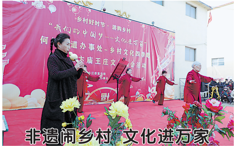
非遗闹乡村 文化进万家

此次活动以传承弘扬雷锋精神为核心,把文明实践深耕与民生服务保障深度融合,让“三下乡”真正成为暖民心、惠民生、聚民力的民心工程,持续推动文明新风吹遍乡村角落。下一步,全市将依托发布的各类惠民项目与服务清单,常态化开展下沉式便民服务,不断丰富基层精神文化生活,助力科技兴农、健康惠民。