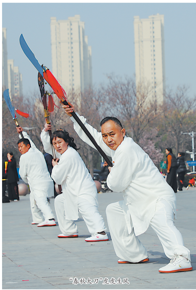
“春秋大刀”虎虎生风