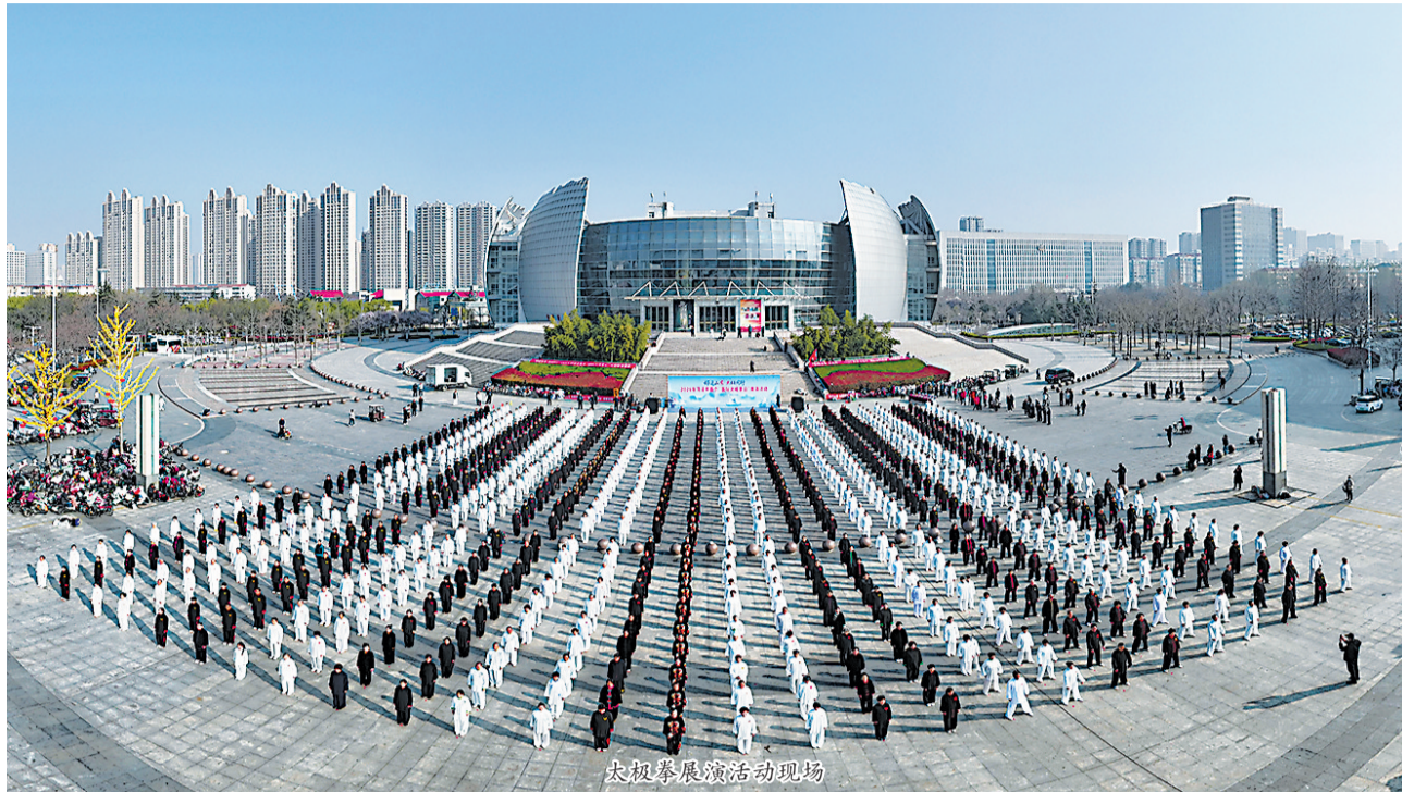
太极拳展演活动现场