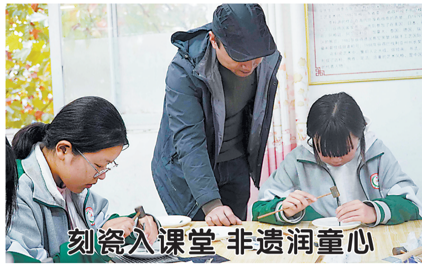
刻瓷入课堂 非遗润童心

日前,在成武县苟村集镇初级中学创客社团,叮叮当当的敲击声此起彼伏,一幅幅花鸟、山水与校园风光渐次在瓷盘上绽放。据悉,2022年,该校引入非物质文化遗产项目代表性传承人,由其常驻指导,让传统技艺扎根课堂。从最初初心无人问津,到短短3天收到50余份报名申请,如今社团已发展成为30余人的校园特色品牌,每周定期开展活动。该社团不仅提升了学生的动手能力,更在潜移默化中增强了文化自信。正如指导老师所言:“希望通过这门技艺,让孩子们感受中华优秀传统文化的魅力。”