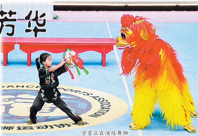
学员正在演练舞狮