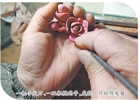
一双小尖刀、一双粗犷的手，成就一只牡丹发簪