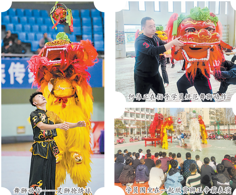
何伟正在指导学员规范舞狮动作