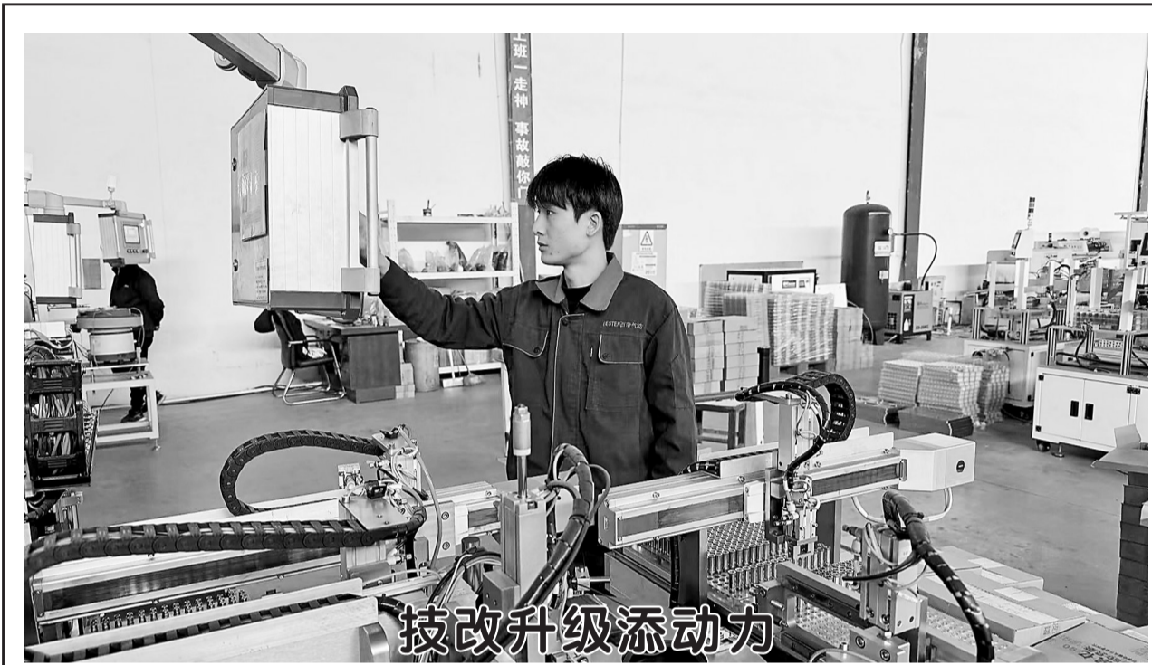
技改升级添动力 近日,在郓城县山东百帝气动科技股份有限公司生产车间里,一条条智能化生产线正平稳有序运转。该企业主营气动元件、电磁阀等产品,是一家集研发、生产、销售于一体的科技型企业。近年来,企业大力推进技术改造与产业升级,引入数控加工中心、工业机器人等先进自动化设备,搭建起现代化生产线,不仅有效提升了生产效率,还进一步增强了企业的核心竞争力。

以标杆引领展示“国枫”风采 岳程派出所辖区人口密集、治安要素复杂。近年来,该所以新时代“枫桥经验”为指引,以工匠精神创新治理模式,成为全市公安派出所标杆。 坚持党建引领,打造基层治理“红色引