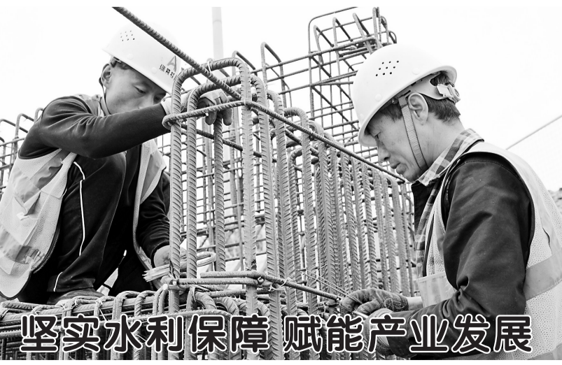
▲近日,在成武县引调水三十三期工程施工现场,农田联通桥建设正有序推进。该联通桥是衔接周边农田水利设施的重要一环,建成后将为当地农业生产、产业提升提供坚实保障。据了解,成武县引调水三十三期工程共涉及6个乡镇,修建改建桥梁25座,清淤河道7千米,惠及周边农田5000余亩,该工程预计5月份完成施工。

常务委员会第二十七次会议通过,2017年1月18日山东省第十二届人民代表大会常务委员会第二十五次会议批准)。 本决定自公布之日起施行。