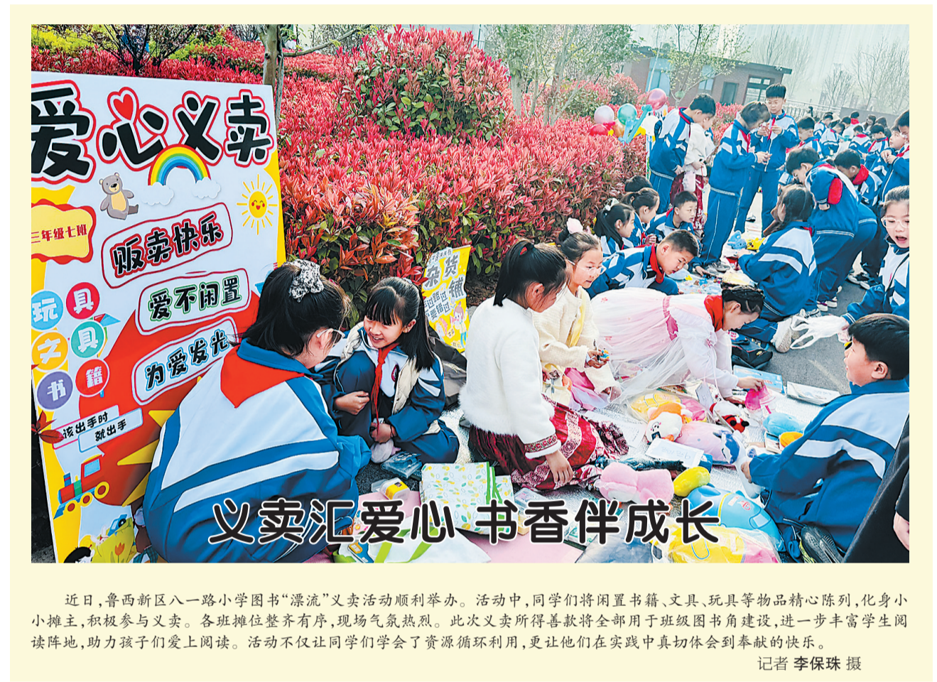
近日,鲁西新区八一路小学图书“漂流”义卖活动顺利举办。活动中,同学们将闲置书籍、文具、玩具等物品精心陈列,化身小小摊主,积极参与义卖。各班摊位整齐有序,现场气氛热烈。此次义卖所得善款将全部用于班级图书角建设,进一步丰富学生阅读阵地,助力孩子们爱上阅读。活动不仅让同学们学会了资源循环利用,更让他们在实践中真切体会到奉献的快乐。

本报讯(记者毛慎沛)近日,菏泽市区一路口上演暖心一幕:一名外卖小哥送餐途中,电动车突发故障无法行驶。眼看订单即将超时,小哥心急如焚。危急时刻,两名热心市民伸出援手,联手修好车辆,解了他的燃眉之急,用凡人善举温暖了一座城。 3月27日17时30分许,市民马红松下班途经大学路与桂陵路路口时,发现一名外卖小哥蹲在电动车旁,神情焦急、手足无措,便主动上前询问情况。经了解,该外卖小哥送餐途中电动车突发故障,手中仍有多个订单等待派送,周边无维修站点,也无法联系到同事协助,担心订单超时延误,小哥急得几乎落泪。“外卖小哥靠送单谋生,订单超时对他们损失不小,看着他着急的样子,我实在不忍心