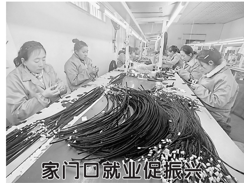
家门口就业促振兴

4月3日,在牡丹区李村镇山东荷鲁电子科技有限公司车间内,工人正在赶制汽车电子线束。该企业专注高频线束研发,产品广泛应用于汽车电子、服务器等领域。作为当地重点产业项目,企业已吸纳周边200余名村民就近就业,实现务工与顾家两不误,为乡村振兴注入强劲动力。