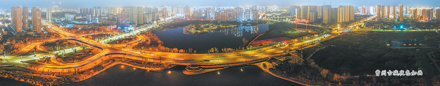
曹州古城夜色如画