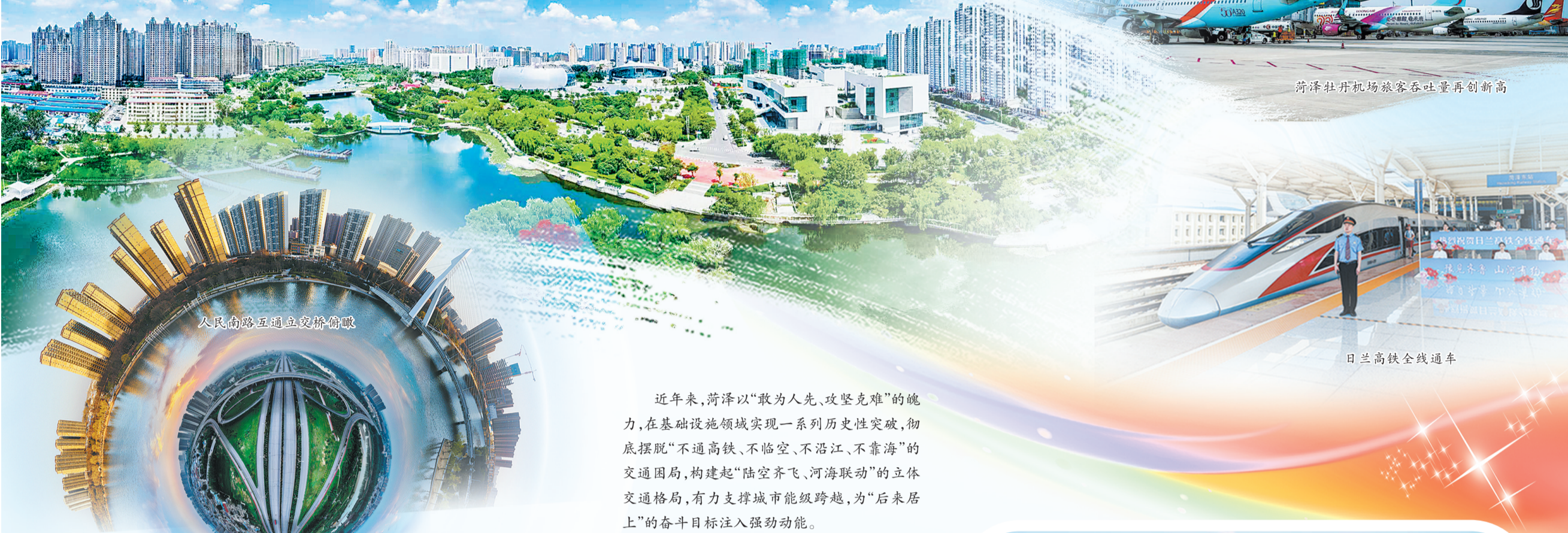
菏泽牡丹机场旅客吞吐量再创新高