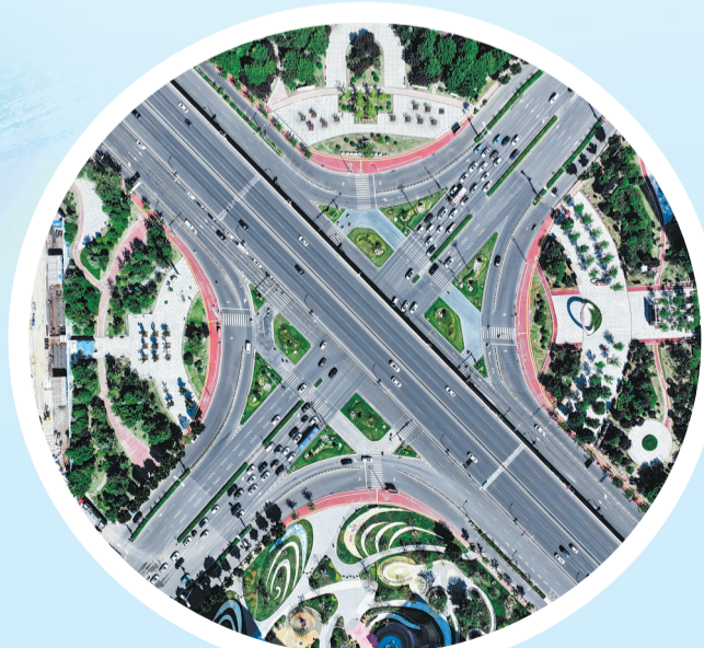
菏泽立体交通俯瞰