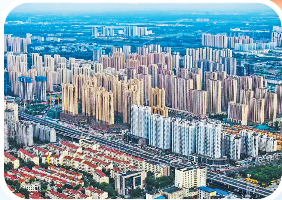
高空下的菏泽建筑群

水运复兴,激活内流通江达海。新万福河航道(一期)通航后,千吨级船舶直达江浙,运输成本显著降低。万丰港、安济河作业区投入运营,“川”字形航道网络基本成型。2026年,新万福河航道二期工程全面进入主体施工阶段,三标段开展“百日大干”,五标段船闸上下闸首完成封顶。项目建成后,将进一步畅通“通江达海”水运大动脉,为大宗货物提供绿色低碳运输方案。