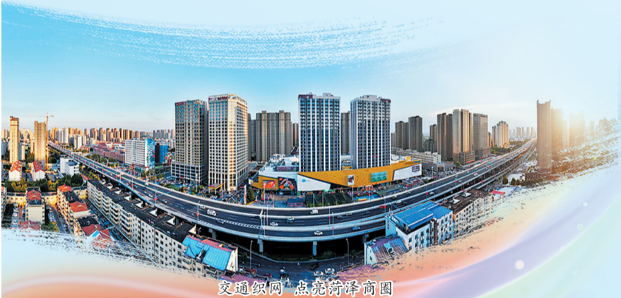
交通织网 点亮菏泽商图