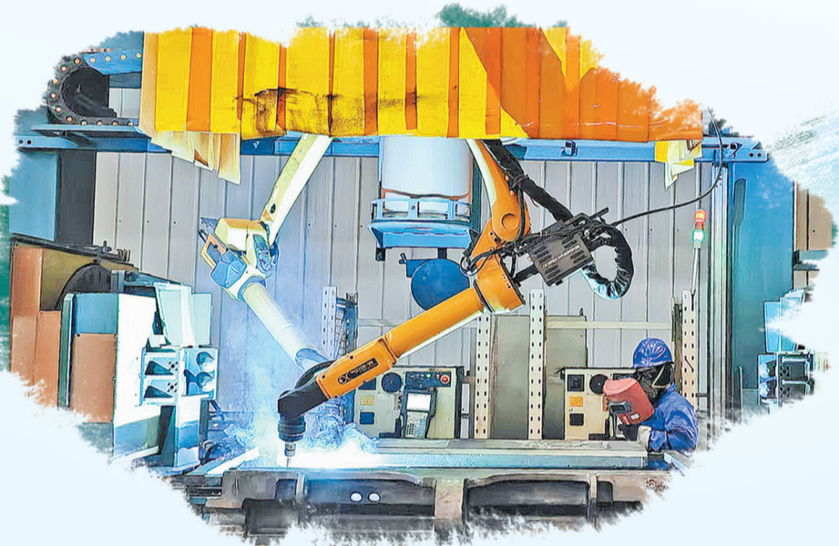
单县久鼎机械智能化生产装备技改项目生产车间,智能化机械手臂正在进行焊接作业

新材料、新一代信息技术等一批面向未来的产业也在我市不断积蓄势能。晶亿新材料国内首创的热解氮化硼技术引领了产业发展方向,有望成为全国产能最大、科技领先的白石墨烯综合加工基地;易信环保高丰度核级硼—10酸打破“卡脖子”难题,实现了国防军工、核医疗关键材料的国产化……向“新”之火已在菏泽大地燃起,一束束火苗汇聚成炬,引燃澎湃动能。