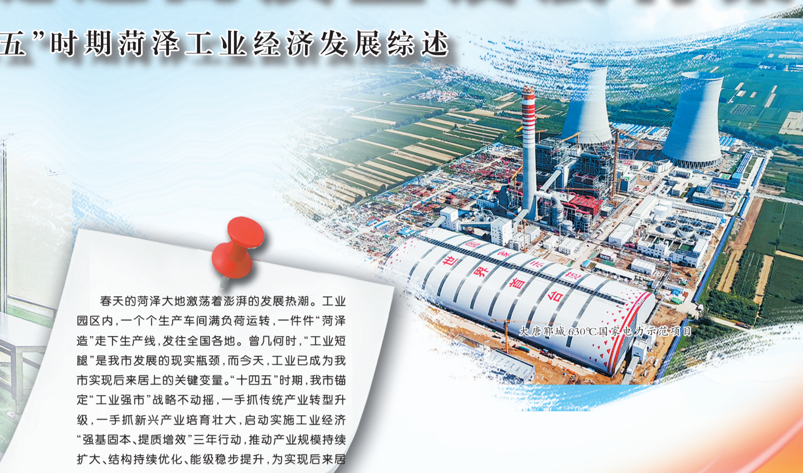
大唐鄄城630℃国家电力示范项目

春天的菏泽大地激荡着澎湃的发展热潮。工业园区内,一个个生产车间满负荷运转,一件件“菏泽造”走下生产线,发往全国各地。曾几何时,“工业短腿”是我市发展的现实瓶颈,而今天,工业已成为我市实现后来居上的关键变量。“十四五”时期,我市锚定“工业强市”战略不动摇,一手抓传统产业转型升级,一手抓新兴产业培育壮大,启动实施工业经济“强基固本、提质增效”三年行动,推动产业规模持续扩大、结构持续优化、能效稳步提升,为实现后来居上奋斗目标奠定了更加坚实的基础。