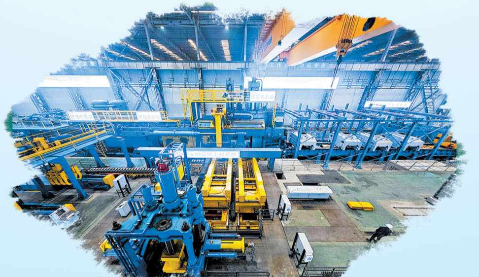
山东铈研新材料科技有限公司一角