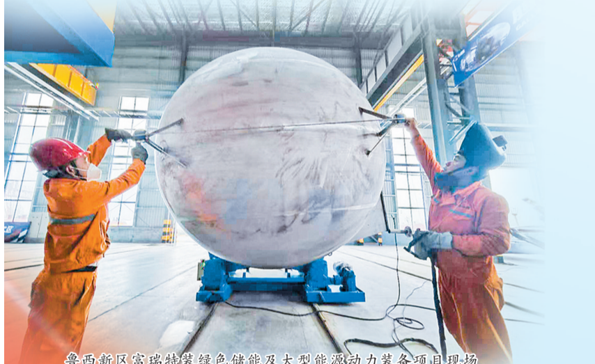
鲁西新区富瑞特装绿色储能及大型能源动力装备项目现场

“市委、市政府高度重视工业企业数字化转型工作,将加快数字化转型作为推进新型工业化、实现‘工业强市’战略的重要途径。目前,已累计培育瞪羚企业超60家、专精特新中小企业620多家。下一步工作中,我们将充分发挥现有的数字经济园区、‘产业大脑’等平台载体的支撑和带动作用,推动龙头企业与上下游中小企业加强合作,实现平台共建、数据共享、业务联动,让大企业、大平台带着中小企业抱团转型。”市工信局局长张体信说。