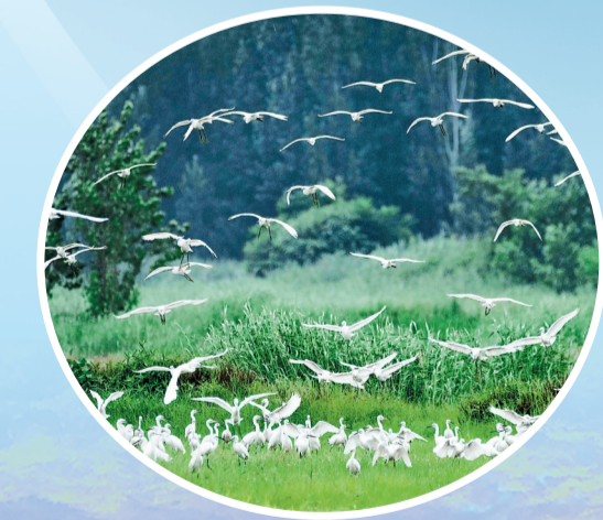
东鱼河成武段白鹭在河边嬉戏

港路网络联城乡,物流通达促循环……行走在成武县大地,一项项打基础、利长远、惠民生的基础设施建设工程稳步推进、落地见效。从交通路网到水利管网,从城市更新到乡村提质,全方位、多层次的基础设施体系不断完善,既筑牢了县域经济社会发展的坚实基础,也让群众的获得感、幸福感、安全感持续提升。