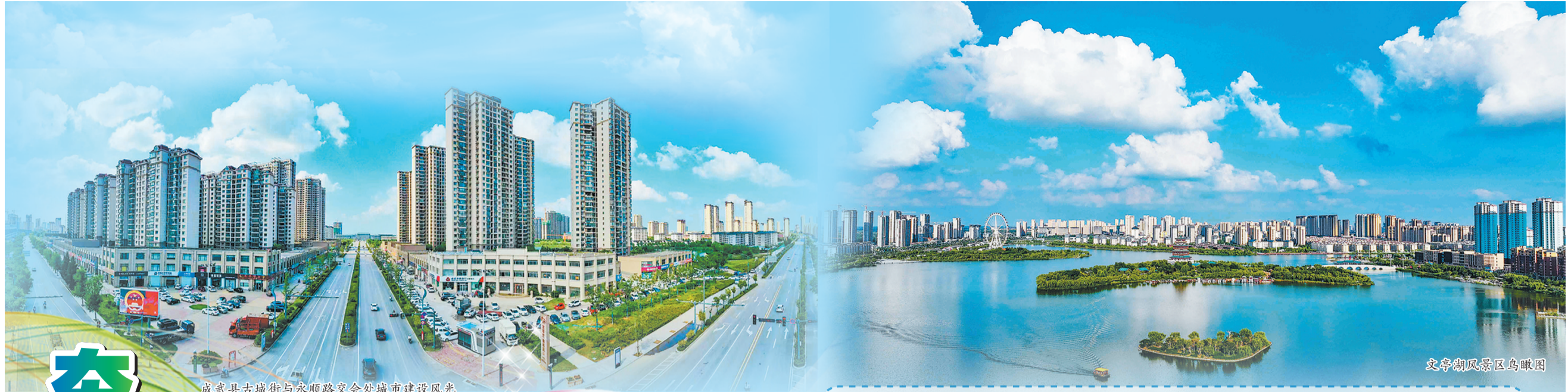
成武县古城街与永顺路交会处城市建设风光