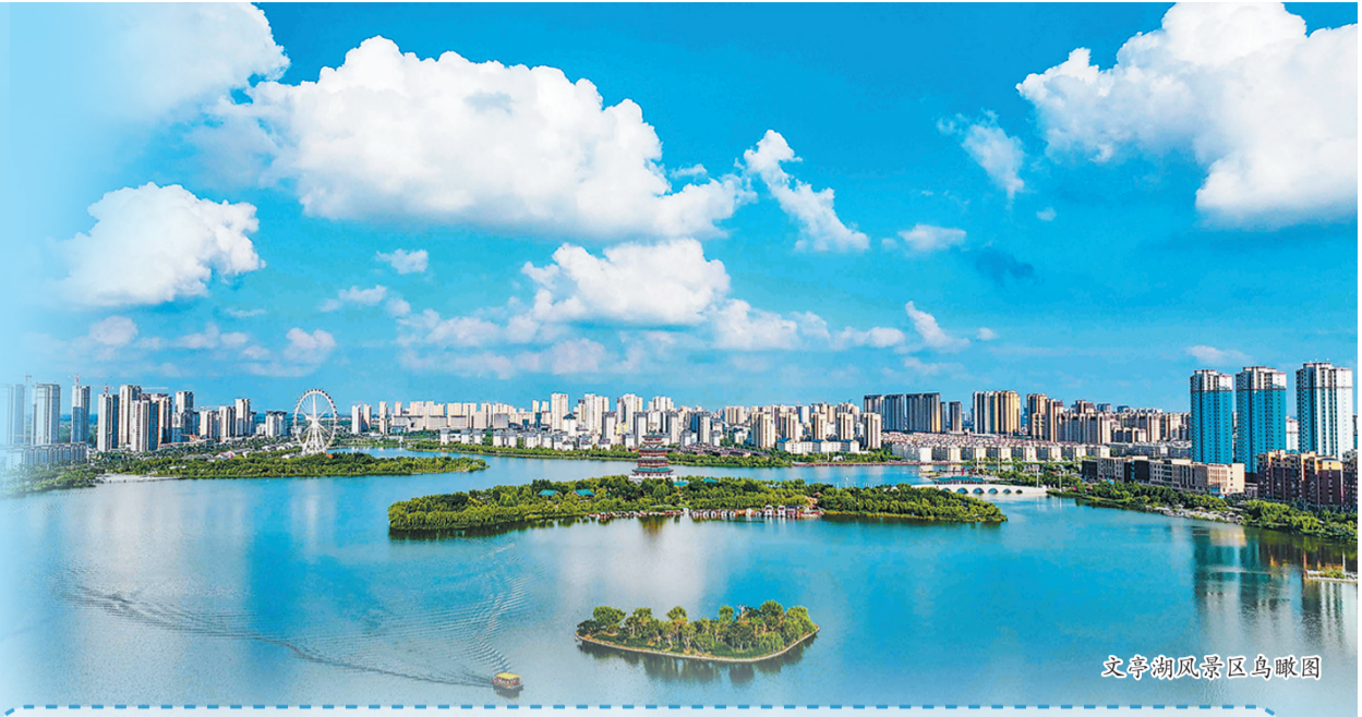
文亭湖风景区鸟瞰图