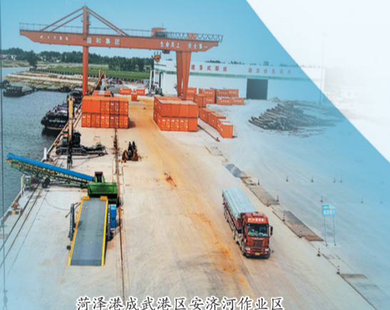
菏泽港成武港区安济河作业区