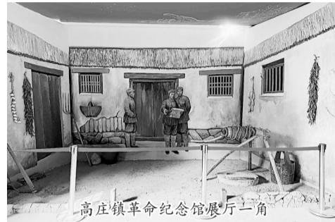
高庄镇革命纪念馆餐厅一角

行走在牡丹区高庄镇的道路上,不必刻意寻觅,总能与一段红色往事不期而遇。圈头村的老槐树虬枝苍劲,菜窖旧址藏着岁月秘密,烈士陵园里松柏常青……一处处静默的遗迹,如同散落在乡野间的历史书签,夹着鲁西南烽火岁月的沧桑,载着革命先辈的赤诚,在时光里静静诉说着那段波澜壮阔的革命征程。