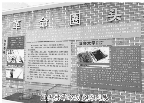
圈头村革命历史陈列展