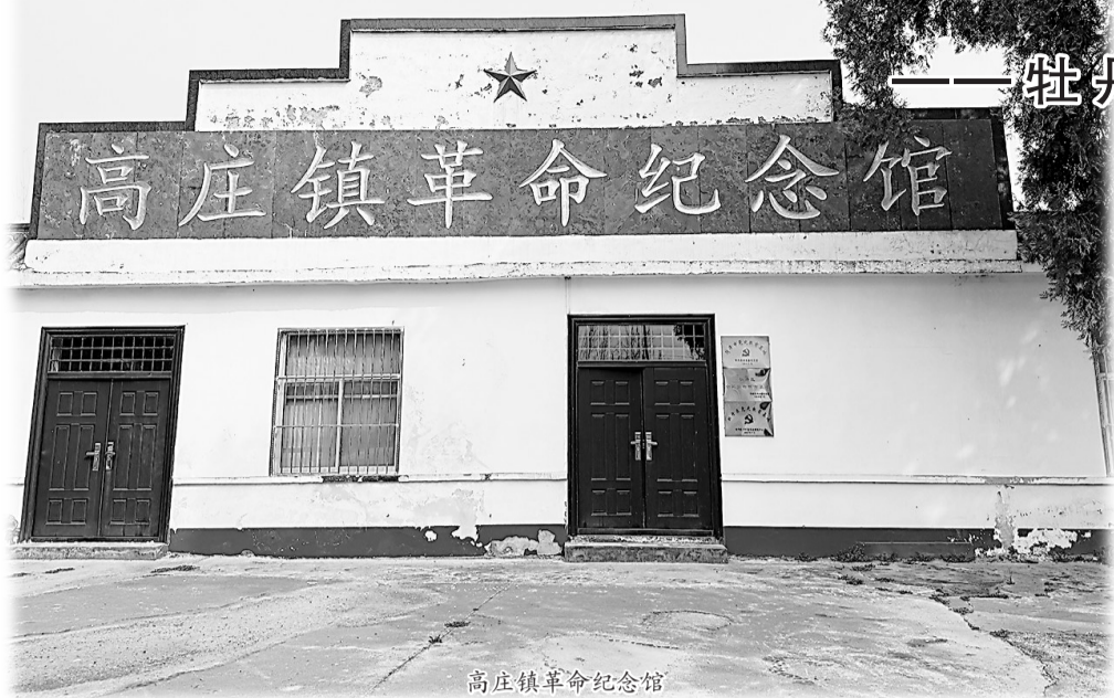
高庄镇革命纪念馆