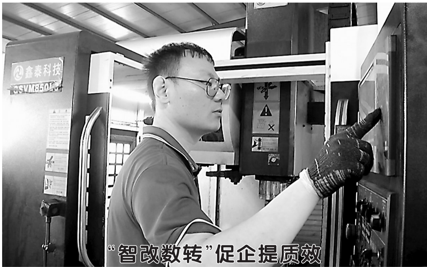
“智改数转”促企提质增效