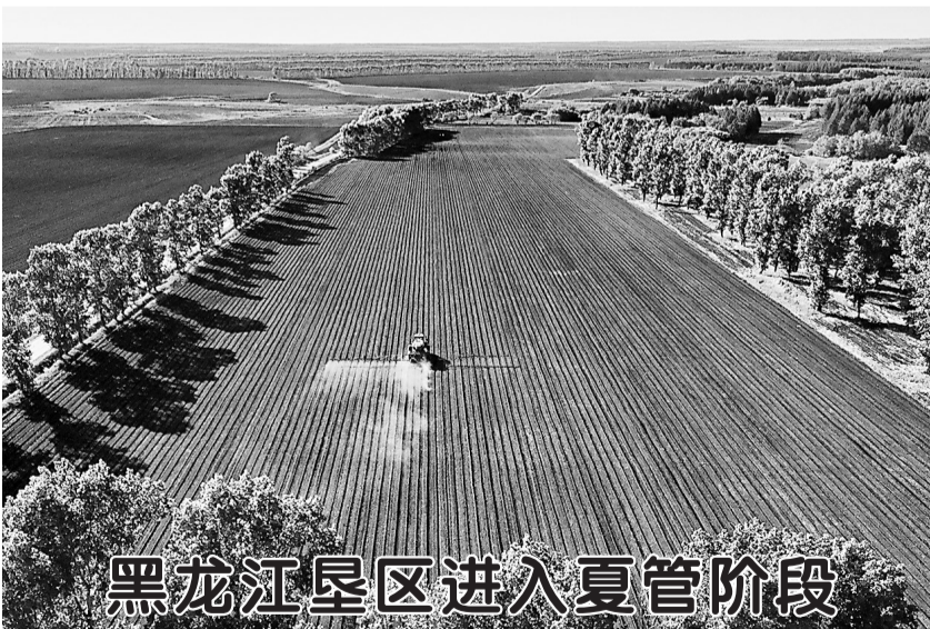
黑龙江垦区进入夏管阶段

北京康达(合肥)律师事务所律师刘锋等法律界人士分析,无论是刷单控评还是有偿删差评,都是在向消费者传递虚假信息,误导公众作出购买决策,严重扰乱市场公平竞争秩序,涉嫌非法经营罪、虚假广告罪等多项罪名。与此同时,这类行为容易衍生侵犯公民个人信息、敲诈勒索等其他