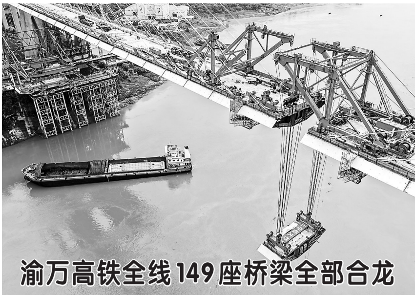
渝万高铁全线149座桥梁全部合龙

对虐待、残害未成年人行为,始终坚持零容忍、严惩戒;对以管教为名施暴,且在法院作出人身安全保护令裁定后,仍然变本加厉实施虐待的,依法对其数罪并罚;对长期实施虐待、残害,手段残忍,致未成年人死亡、罪行极其严重的,坚决依法从严惩处,以绝不姑息纵容的司法裁判,向以“为了孩子好,不打不成器”“家事免费”等为借口侵害未成年人的违法犯罪行为坚决说不。 家庭内部侵害未成年人行为隐蔽性强、危害持久,必须坚决遏制。在相关案件处置中,法院依托校园法治工作室,联动政府职能部门,综合运用人身安全保护令、撤销监护资格、刑事追责、司法救助、心理疏导、判后回访等举措,构建“发现—干预—追责—救助—保护”全链条保护渠道,推动形成多部门协同、全社会参与的未成年人保护格局,确保犯罪行为得到依法惩处,未成年人得以妥善安置。