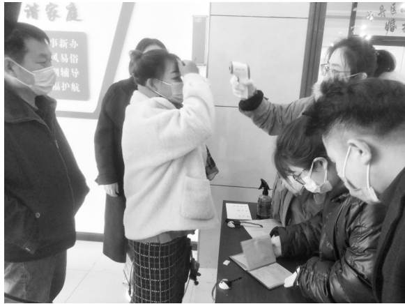
工作人员为办理业务的群众测量体温。

本报讯(牡丹晚报全媒体记者 艳粉) 牡丹晚报全媒体记者从民政部门获悉,目前,菏泽各县区婚姻登记处已恢复办理业务,但因防控疫情需要,为避免人群聚集,办理婚姻登记等业务需提前电话预约,而婚姻家庭辅导、结婚办证仪式服务已经暂停。