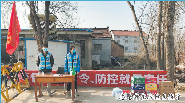
志愿者在防控点值守

在全国第57个“学雷锋纪念日”到来之际,市文明办、团市委、市民政局联合爱心企业莱商银行,开展慰问疫情防控一线志愿服务组织和志愿者活动,走访全市多家新时代文明实践站所、志愿服务组织和志愿者家庭。各县区慰问活动同步进行。