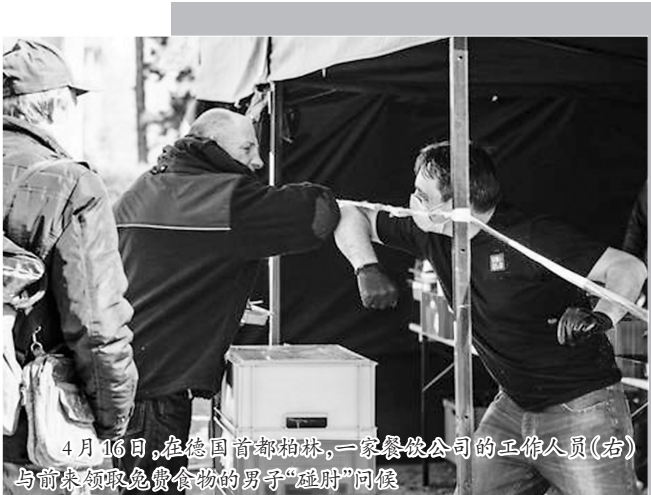
4月16日,在德国首都柏林,一家餐饮公司的工作人员(右)与前来领取免费食物的男子“碰肘”问候

据美国约翰斯·霍普金斯大学统计,截至北京时间20日9时30分,全球新冠肺炎确诊病例超过240万例,死亡病例16.5万例。19日,二十国集团卫生部长召开视频会议,认为应提高各国对流行病的防范能力,强调在当前和未来的流行病疫情中运用数字化解决方案的重要性。 目前,美国疫情仍在持续,确诊病例累计已逼近76万例。然而,在这种情况下,美国居家令开始出现松动,个别州也宣布了逐步恢复经济的具体步骤,其中蒙大拿州将于4月24日开始解除疫情隔离限制。俄亥俄州、北达科他州和爱达荷州已建议非必要的企业做好5月1日复工的准备。 与美国急切希望重启经济不同的是,欧洲一些国家对复工持相对谨慎的态度。 19日法国巴黎市政部门宣布,在检测的27个城市非饮用水系统采样点中的4个发现了微量新冠病毒,卫生部门将进一步分析这些微量病毒可能存在的风险。法国总理菲利普19日强调,在疫情得到控制、医院恢复收治患者能力后,才能考虑解除管制措施。他还说,“解封”后,法国公共交通系统有可能强制要求乘客戴口罩。 英国内阁办公厅大臣戈夫19日也表示,鉴于死亡人数的增长,英国政府目前尚未考虑放松为控制新冠肺炎疫情采取的管控措施。“过高的死亡人数令人深感忧虑。有证据表明,感染率和死亡率正趋于平稳,但我们不能完全确定我们处于下降趋势。” 德国总理府部长布劳恩则表示,“群体免疫”不是适合德国应对疫情的策略。他解释说,若要在18个月内让一半以上德国人口免疫,每天需有7.3万人感染新冠病毒,德国医疗系统将无法承受这种压力。因此,联邦政府采取的措施是避免感染,直到疫苗问世。德国政府日前决定,将持续至本月19日的社交限制措施至少延长至5月3日。 印度疫情不容乐观。截至19日,印度累计确诊15712例,死亡507例。印度最大贫民窟塔拉维贫民窟确诊病例增至117例,死亡10例。该贫民窟已被当地政府划为疫情重点地区。当地政府根据贫民窟内确诊病例的位置所在,划出多个隔离区,以进行封闭式管理。 据非洲疾控中心的数据,截至19日,非洲累计确诊病例已超2.1万例,死亡超1000例。为应对疫情,塞内加尔总统萨勒表示,或将每日宵禁时间延长3个小时,以应对越来越多的社区传播病例;卢旺达卫生部呼吁民众佩戴口罩;南非正在加建“方舱医院”,供没有条件居家隔离的轻症患者使用。 19日的二十国集团卫生部长会议认为,各国有必要通过共享知识,弥合各国在应对能力和准备状况方面的差距,以提高全球卫生体系的有效性。