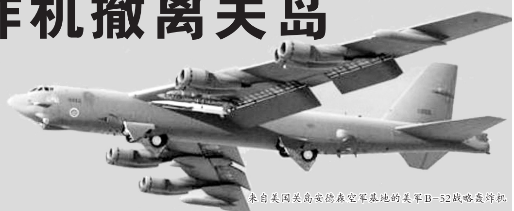
来自美国关岛安德森空军基地的美军B-52战略轰炸机

眼下,美国海外属地关岛上面没有一架重型轰炸机,16年来,这还是第一次。在没有任何战机“补位”的情况下,美军5架B-52轰炸机日前悉数撤出关岛安德森空军基地,飞回本土,结束长达16年的“轰炸机持续存在”任务。 分析人士认为,此举既是受疫情影响的权宜之策,更是美国作战策略的一种转变。看似减法实为加法,是美国推进印太战略的重要步骤,未来,更具弹性的战略部署将会比过去的前沿部署让美军的拳头变得更硬。