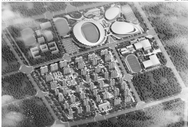
魏海片区安置地块修建性详细规划