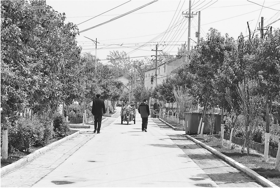
巨野县柳林镇农村新建道路平坦、整洁、优美(上图)，通户道路硬化正加速推进(下图)，硬化后的巷道让村民出门就能走上水泥路(右图)。

不远处，慢悠悠骑着自行车的老人和开心地蹬着儿童车的小孩子一起，从阳光下的花圃旁路过，跟邻里打着招呼，沿着村里的主干道渐渐走远。