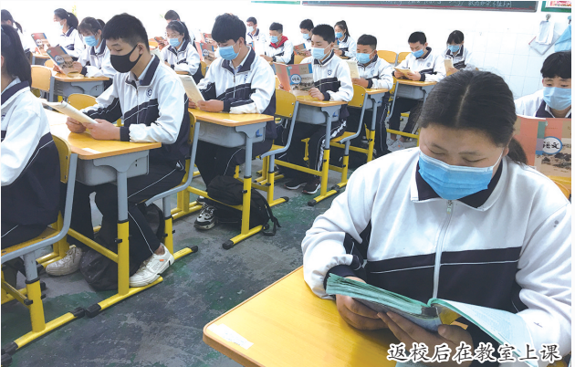
返校后在教室上课