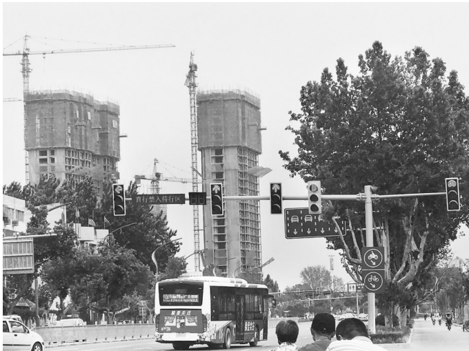
公交车专用信号灯的启用将进一步提升公交车运行效率

公交车专用信号灯有两个功能:一是公交车直行车辆应按照公交车专用信号灯的指示通行,左转或右转按常规信号灯指示通行;二是在一个信号灯周期内增加一次通行次数。在南北方向直行灯结束后,公交车专用信号灯显示为绿灯直行(时间平峰约8秒,高峰约12秒,预计通行两车次)。此时,路口信号灯全为红灯,只有公交车信号灯为绿灯。