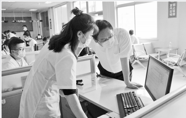
跨县区就医出院即时报销为参保患者带来更多方便

本报讯 (牡丹晚报全媒体记者 武霏 ) “市内无异地”是医保部门推进医保便民的重要举措,也是解决参保患者跨县区住院与报销两头跑的有效手段。记者从菏泽市医疗保障局获悉,我市自今年6月份开始全面推行医保报销“市内无异地”,参保人员在全市公立医院住院均可出院即时结算报销。此举意味着,跨县区就医患者再也不需要在参保地和医院之间来回奔波申报结算,既方便了群众,也节省了医院的人力资源成本。