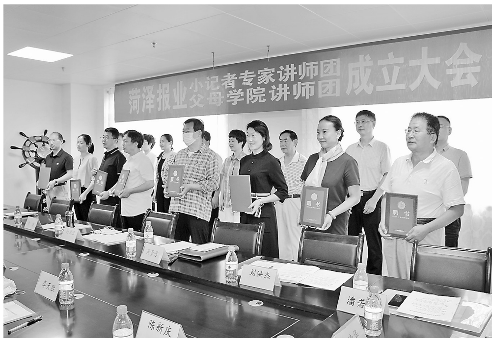
与会领导为讲师团成员颁发聘书

本报讯 (牡丹晚报全媒体记者 艾慧丽 ) 昨日,菏泽报业小记者专家志愿讲师团、菏泽报业父母学院讲师团成立。市政协副主席、致公党菏泽市委主委、市社会主义学院院长孙凤云,市委宣传部原副部长、讲师团原团长、市关工委副主任黄贵芳,菏泽报业传媒集团董事长、菏泽日报社党委书记常健,市委宣传部分管副部长刘红,市教育局副局长刘洪杰,市文化和旅游局副局长张梅,菏泽日报社副总编辑、牡丹晚报总编辑潘若松等出席成立仪式。