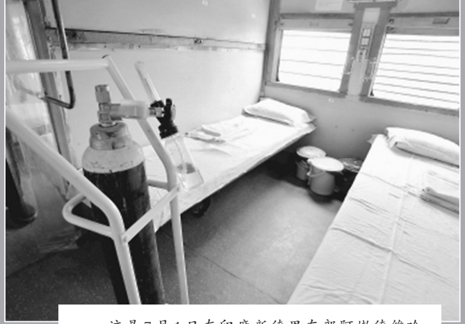
这是7月1日在印度新德里东部阿嫩德维哈尔火车站拍摄的由火车车厢改造而成的新冠隔离点。印度是目前亚洲地区累计新冠确诊病例数最多的国家。