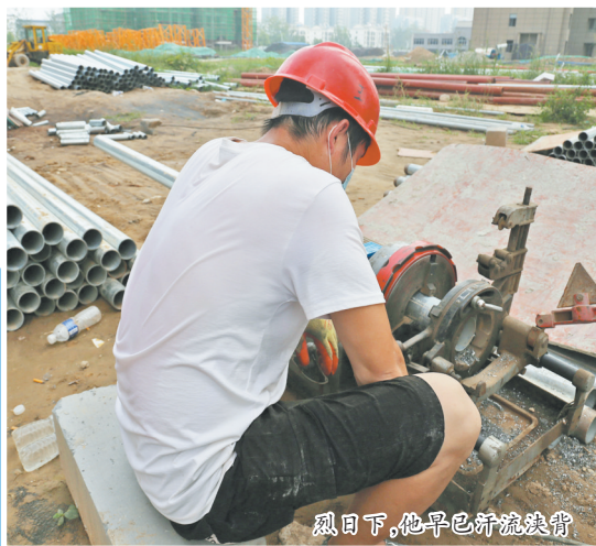
烈日下,他早已汗流浹背

据菏泽永恒热力有限公司工作人员介绍,夏季是设施和管网“体检”的最佳时期,设备的检修、维护、保养工作甚至比供暖季更加繁重。经过整个夏季的烘烤,换热站的操作机房内已无比闷热潮湿,让人感觉很不舒服。而在这样的环境下,热力人员每天都要进去几个小时,衣服湿了又干,干了又湿,每天汗如雨下,机器设备的轰鸣声早已成为他们最熟悉的工作环境。