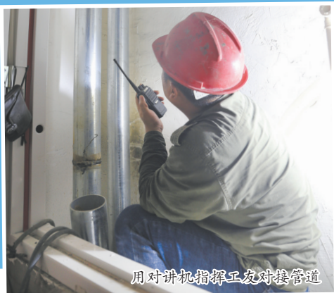
用对讲机指挥工友对接管道