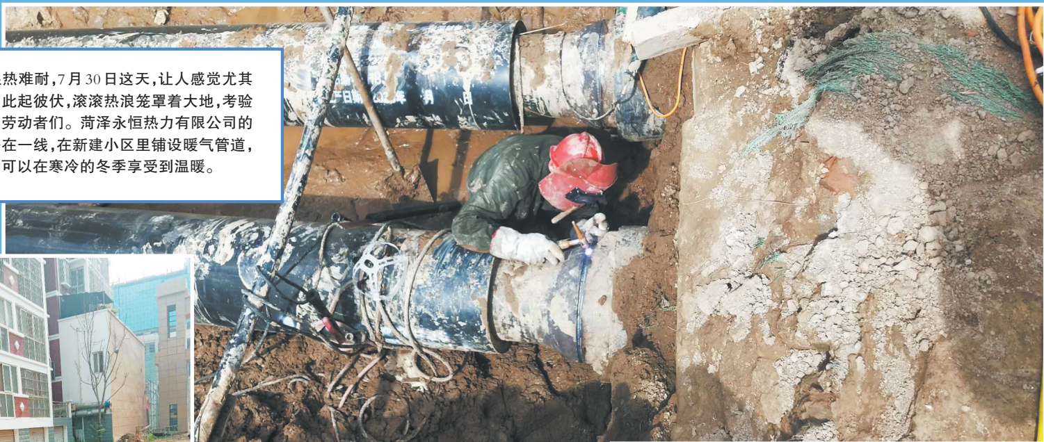
烈日伴着泥土,认真工作

“三伏天”湿热难耐,7月30日这天,让人感觉尤其闷热。室外蝉鸣此起彼伏,滚滚热浪笼罩着大地,考验着奋战在一线的劳动者们。菏泽永恒热力有限公司的管道安装工坚守在一线,在新建小区里铺设暖气管道,只为居民入住后可以在寒冷的冬季享受到温暖。