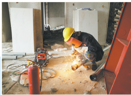
夏天,他始终与火花为伴