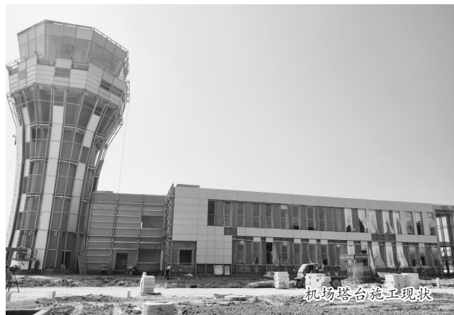
机场塔台施工现状

本报讯 (牡丹晚报全媒体记者 云华) 本月,菏泽牡丹机场建设速度加快,航站楼、塔台、跑道等施工又有新进展,预计10月底校飞。8月18日,牡丹晚报全媒体记者再次到菏泽牡丹机场施工现场探访。