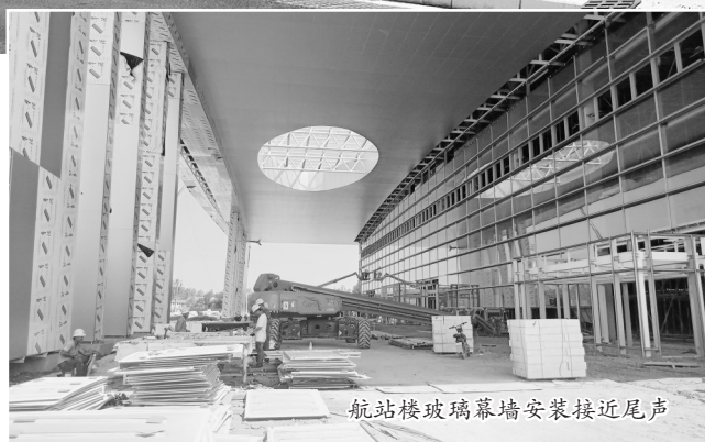
航站楼玻璃幕墙安装接近尾声