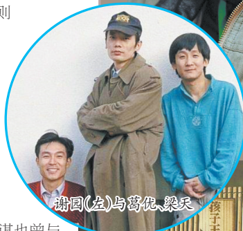
谢园(左)与葛优、梁天