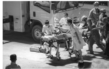
山西襄汾县陶寺乡陈庄村聚仙饭店坍塌事故救援现场,救援人员正在搜救被困人员。