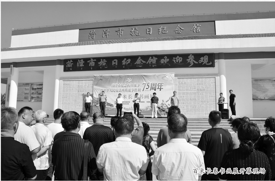
百米长卷书画展开幕现场

本报讯(牡丹晚报全媒体记者 姜培军 实习生 谭千千) 9月3日,是中国人民抗日战争暨世界反法西斯战争胜利75周年纪念日,为纪念这一重大历史事件,由市委宣传部、市退役军人事务局、菏泽军分区政治工作处联合主办的纪念抗日战争暨世界反法西斯战争胜利75周年百米长卷书画展在菏泽市抗战纪念馆举行。