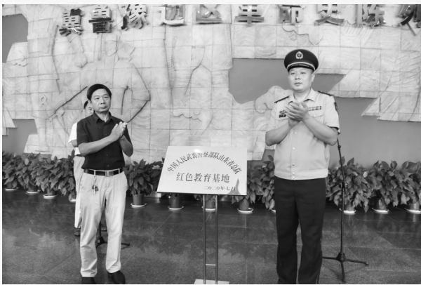
武警菏泽支队“红色教育基地”成立仪式现场

本报讯(牡丹晚报全媒体记者 姜培军 实习生 谭千千) 9月3日,山东省武警总队“红色教育基地”在冀鲁豫边区革命纪念馆挂牌成立。冀鲁豫边区革命纪念馆工作人员、武警官兵共100余人参加成立仪式。