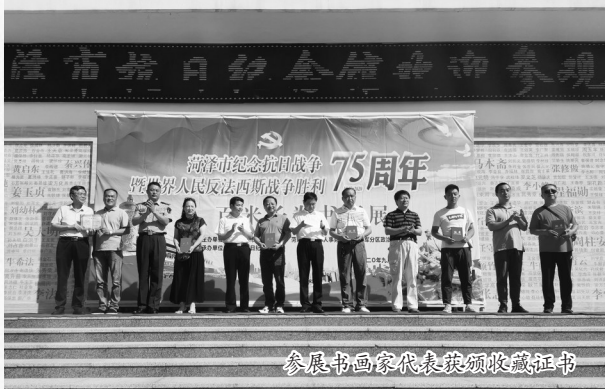
参展书画家代表获颁收藏证书

本次书画展,一方面展示了我市爱国主义教育、精神文明建设所取得的重大成就,另一方面也是我市经济快速稳定、科学发展的重要体现,为我市纪念抗日战争胜利75周年营造了薪火相传、奋发有为的良好氛围。