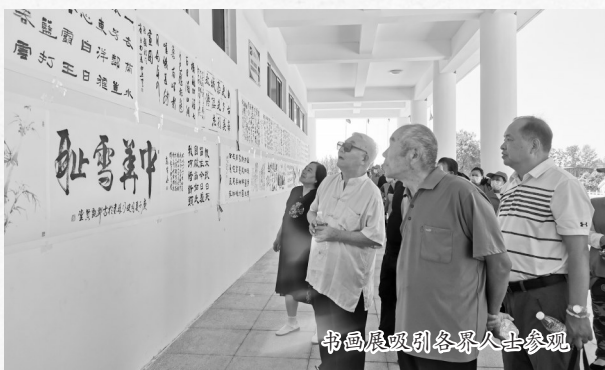
书画展吸引各界人士参观