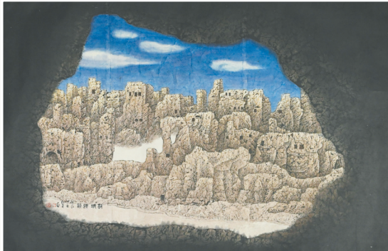
► 故城遗韵 2