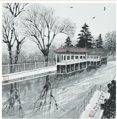
► 环城公园组画二十五