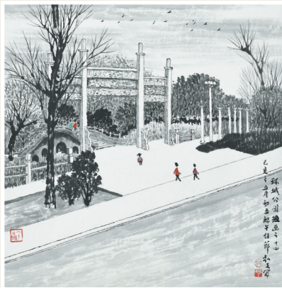
► 环城公园组画二十四