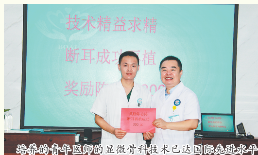
培养的青年医师的显微骨科技术已达国际先进水平