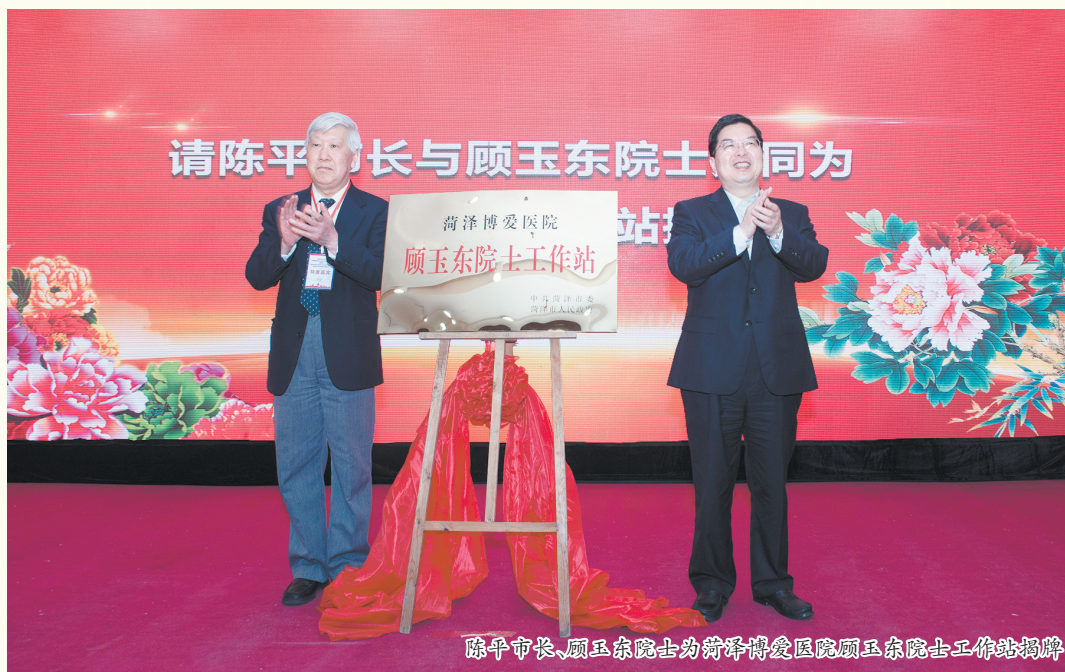
陈平市长、顾玉东院士为菏泽博爱医院顾玉东院士工作站揭牌