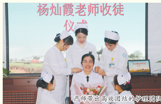
严师带出高效团结的护理团队