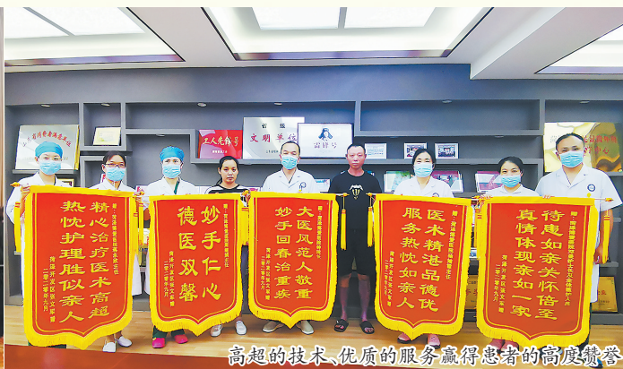
高超的技术、优质的服务赢得患者的高度赞誉