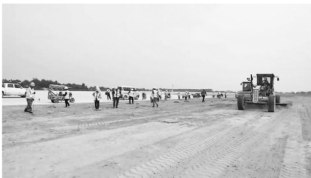
机场跑道两侧场地平整工作进入尾声