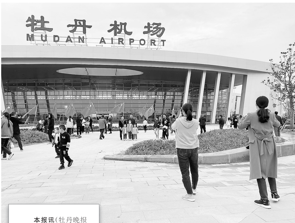
大气美观的牡丹机场航站楼吸引众多市民参观、拍照

本报讯(牡丹晚报全媒体记者 云华 郭青) 牡丹晚报全媒体记者昨日从菏泽牡丹机场方面获悉,自9月底航站楼“挂牌”、10月初登机廊桥完成第一次对接调试后,牡丹机场本月中下旬将迎来竣工验收。