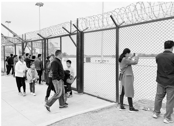
市民遥望牡丹机场飞行区