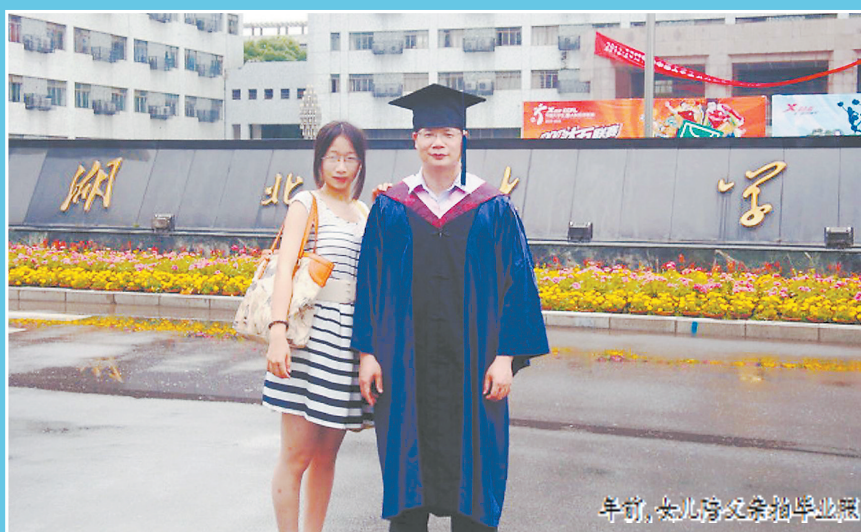
年前,女儿陪父亲拍毕业照