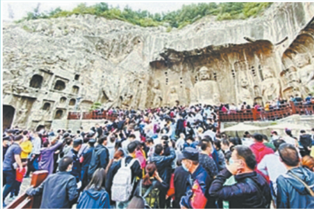
龙门石窟景区游人如织