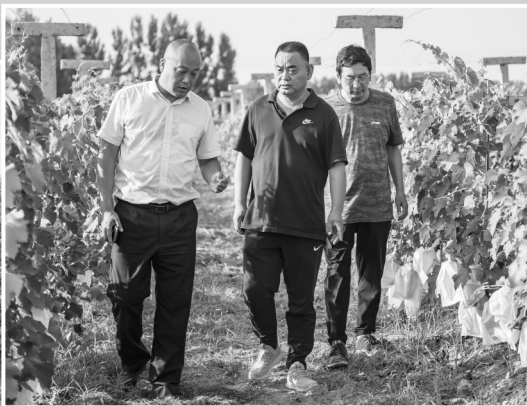
农行东明县支行发放50万元强村贷支持东明县庆国农作物种植专业合作社带动9户贫困户脱贫。图为支行领导到合作社葡萄园调研。