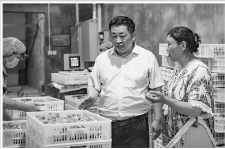
农行成武县支行发放第一笔强村贷90万元支持成武农耕种植合作社。图为支行领导到合作社禽乐孵化场调研考察。