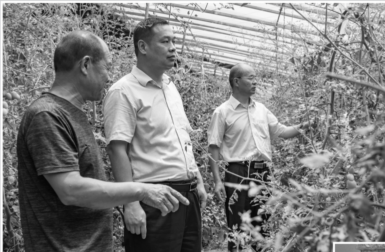
农行单县支行发放300万元鲁担惠农贷支持单县方程田园综合体带动60个贫困户脱贫。图为支行领导到西红柿园查看蔬果生长情况。