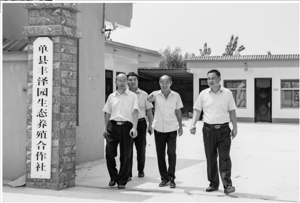
农行单县支行发放100万元强村贷支持单县丰泽园生态养殖合作社带动20户贫困户脱贫。图为支行领导到合作社调研。