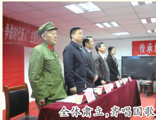
全体肃立,齐唱国歌

为纪念中国人民志愿军抗美援朝出国作战70周年,10月22日上午9时,由山东省菏泽信息工程学校团委组织,在该校实训综合楼多功能会议厅举行“致敬抗美援朝·争做时代新人”主题宣讲活动,传承红色基因,弘扬革命精神。