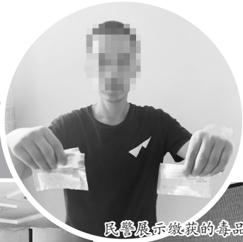
民警展示缴获的毒品