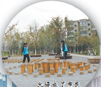
大堤成了市民休闲娱乐的好去处