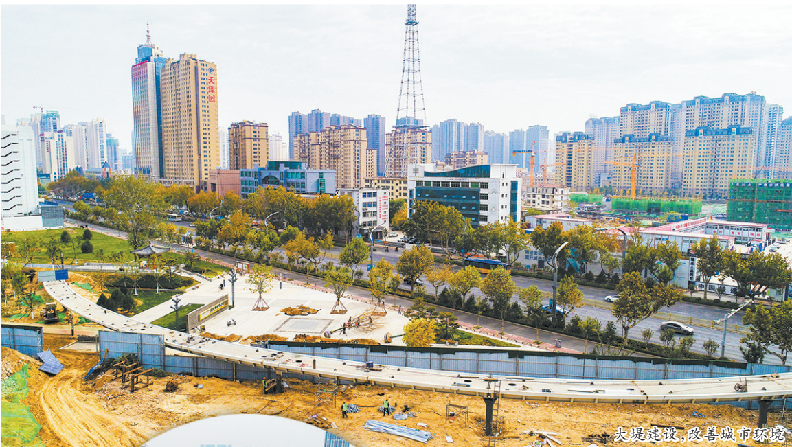
大堤建设,改善城市环境