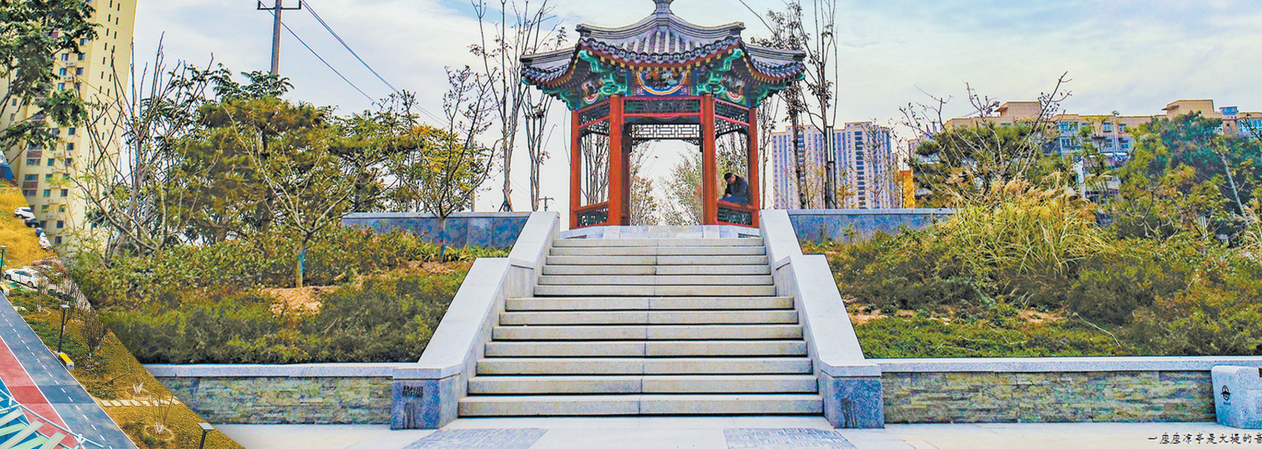
一座座凉亭是大堤的音符