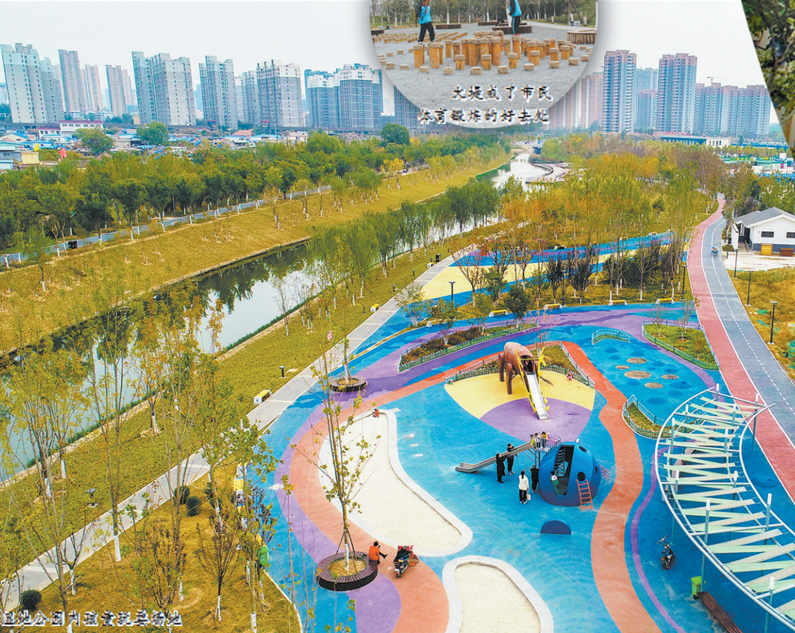
环堤公园内碧波荡漾

环堤公园的建设优化了“外圆内方”的古城格局,再现了“花城水邑、碧水菏泽”的城市风貌,已成为菏泽城市新名片。