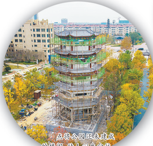
点将公园还未建成的楼阁,让人心生向往