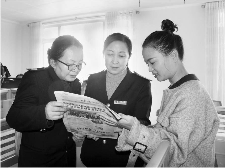
菏泽汽车总站工作人员到本报编辑部办理和贫困娃“认亲”手续

本报讯(牡丹晚报全媒体记者 淑娅) 11月10日,由共青团菏泽市委、牡丹晚报联合主办的第十六届希望工程菏泽认亲会启动第二天,又有33名贫困娃被“认亲”,目前还剩60名贫困娃等待与爱心人士“结亲”,欢迎广大爱心市民积极参与。 11月10日一早,菏泽汽车总站的工作人员来到牡丹晚报编辑部,捐赠2000元爱心款,“认”下两名贫困儿童。这位工作人员说:“往年我们也参与过这项活动,知道‘认亲’流程,我们想帮扶两个牡丹区的孩子,这样平时方便去看望他们。我们和往年‘认’下的贫困娃一直都有联系,平时会帮助他们,给他们买些学习、生活用品,希