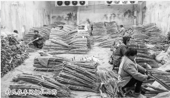
村民在车间捆扎山药

这些装满山药的恒温库，正是村中已荒废多年的废旧厂房。通过“变废为宝”，既带动了山药种植产业发展，带动贫困户增收，形成了鲁西南地区的山药交易集散中心；又盘活了村级集体财产，实现了村级集体财产的保值增值，通过租金收入为贫困户分红；促进了当地就业，吸纳有劳动能力的贫困户到恒温库、山药种植基地工作，增强了贫困群众的参