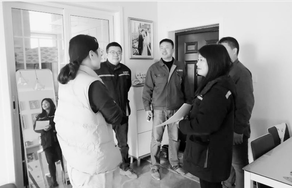
上图:热力公司工作人员入户走访,了解用户用暖情况。

民生热力还进一步增强回访频次,加强与热用户沟通联系,确保及时发现问题、解决问题,避免造成用户用热故障。