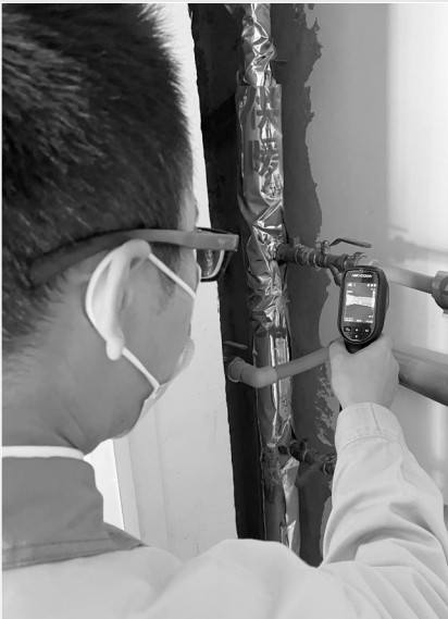
下图:全面排查供热设施,确保供热系统运行稳定。