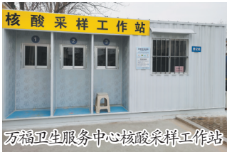
万福卫生服务中心核酸采样工作站