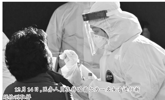
12月14日,医务人员在韩国首尔为一名女子进行新冠检测取样

政府14日说,首都首尔市前一天出现两例死后被确诊的新冠病例,引发关注。 韩联社援引首尔市政府数据报道,首尔市13日新增三例新冠死亡病例,其中两例为死亡后被确诊感染新冠病毒,均为患有基础疾病的老年人。 与其他地区相比,韩国首都圈疫情尤其严峻。首尔市政府14日说,该市13日新增219例新冠确诊病例,较12日的399例大幅减少,可能由于周末检测数量少于平日。专家预测单日确诊病例数可