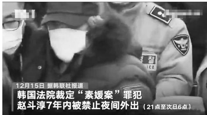
12月15日 据韩联社报道 韩国法院裁定“素媛案”罪犯赵斗淳7年内被禁止夜间外出(21点至次日6点)

12月15日,据韩联社报道,韩国法院裁定“素媛案”罪犯赵斗淳7年内被禁止夜间外出(21点至次日6点)。此外他还被禁止过度饮酒,血液酒精浓度不得超过0.03%。不得出入幼儿园、小学、初中等教育场所及儿童游乐场,禁止其接