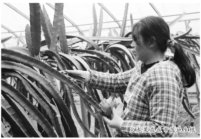
火龙果在我市落地生根

与此同时,各镇(乡、街道)要将围绕打造镇域主导产业,着力培育壮大新型农业经营主体,做大农产品加工流通业,做强休闲农业和乡村旅游业,做优乡村服务业等新产业,推动全环节升级、全链条升值、全产业融合,促进乡村产业振兴。