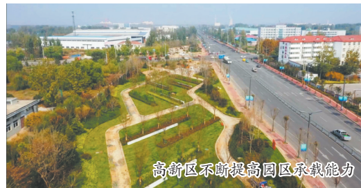
高新区不断提高园区承载能力

菏泽高新区紧紧围绕市委常委会精神,坚持敢于发展、敢于领先、敢于提速,全面推进体制机制改革创新,更加突出“经济发展、科技创新、双招双引、改革开放”等主责主业,持续做好“高”“新”“区”三字文章,加快创建国家高新区。