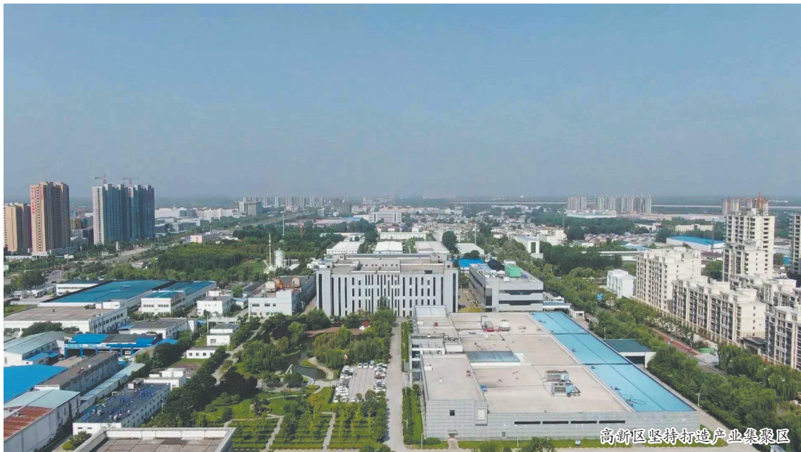
高新区坚持打造产业集聚区