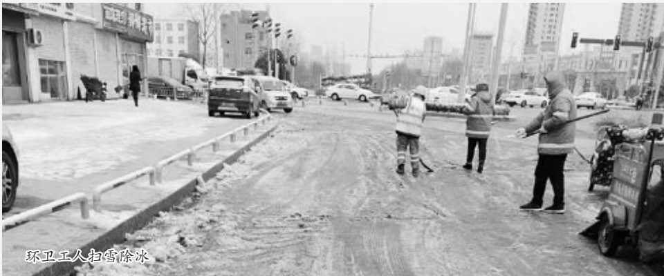
环卫工人扫雪除冰