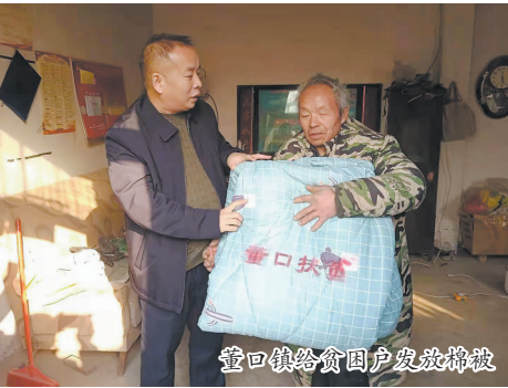
董口镇给贫困户发放棉被

本报讯(牡丹晚报全媒体记者 文杰 通讯员 宁效广) “这大衣真暖和!”“还有新被子、新床单,你看多好啊!”2020年12月26日上午,在鄆城县凤凰镇酒店张村委会院内一片热闹景象,冬日送温暖集中发放活动在这里举行,领到棉物的群众不时发出这样的称赞声。 寒冬已至,贫困群众的冷暖始终牵动着鄆城县各级党组织的心。鄆城县把该项工作作为年底工作重中之重,下村入户排查贫困群众取暖措施、讲解防治一氧化