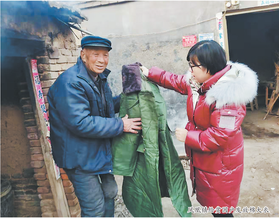
凤凰镇给贫困户发放棉大衣

情,加之春节临近,疫情防控形势依然复杂严峻。希望大家科学精准做好鄆城县常态化疫情防控工作,坚决克服麻痹思想、厌战情 绪、侥幸心理、松劲心态,把来之不易的防控战果巩固好、拓展好,持续为全县人民群众营造一个安定祥和的节日环境。