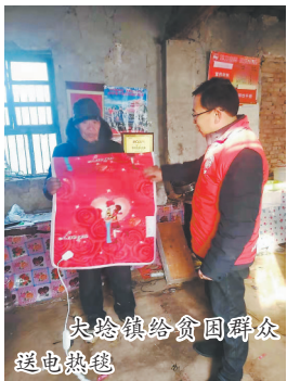
大陈镇给贫困群众送电热毯