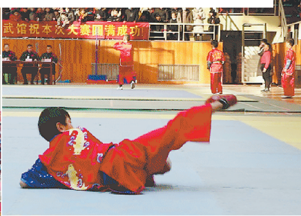
▲赛前表演 ▲比赛现场