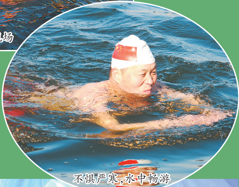
不惧严寒,水中畅游