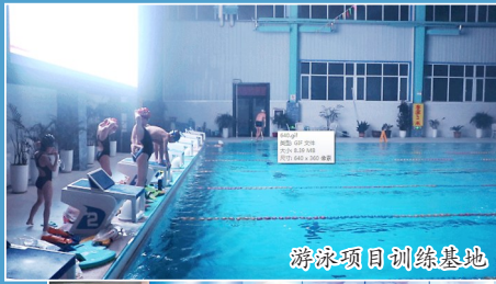
游泳项目训练基地

这些年的努力,菏泽市游泳训练队伍已经初具规模。目前,游泳队正在选材和系统训练中,储备游泳、铁人三项和现代五项等项目的后备人才。 牡丹晚报全媒体记者了解到,市游泳项目训练基地现有8条标准的50米泳道,我市将依托训练基地良好的环境、水质和设施条件,进而促进体校学生成绩不断提高,培养和输送出更多的优秀运动员,为菏泽游泳事业增光添彩,为国家游泳事业做出更多的贡献。