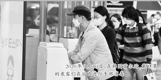
2020年9月30日,在韩国首尔站,戴口罩的乘客们在站内进行手部消毒

韩国行政安全部3日发布的人口数据显示,韩国户籍登记人口数量2020年首次出现减少,总登记人口不足5200万。不少人呼吁政府采取更多措施,应对出生率低迷和老龄化严重的问题。