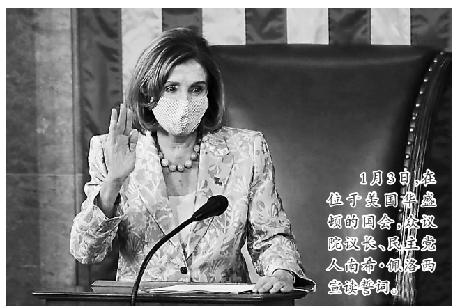
1月3日,在位于美国华盛顿的国会,众议院议长、民主党人南希·佩洛西宣读誓词。

第117届美国国会3日开幕并投票选举新一届众议院议长。现任众议院议长、民主党人南希·佩洛西获得连任,开启她在该职位上的第四个两年任期。