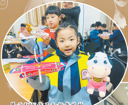
展示DIY作品和新年礼物