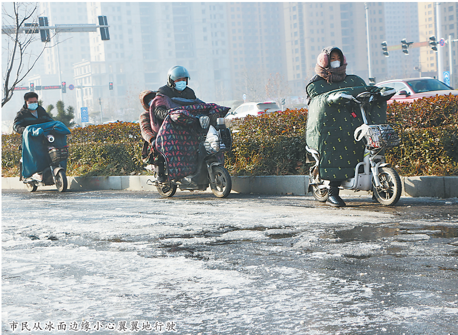
市民从冰面边缘小心翼翼地行驶

寒潮天气来袭，1月6日，菏泽最低温度达到零下13度，受天气影响，道路积水极易出现结冰现象。当日上午，有热心市民拨打牡丹晚报新闻热线反映，在市长江路和人民路交叉口有一路段积水严重、大面积结冰，上班高峰期“撂倒”了不少行人。随后，牡丹晚报全媒体记者立即赶赴现场采访，并向有关部门反映，启动抢修。