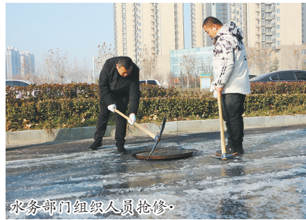
水务部门组织人员抢修