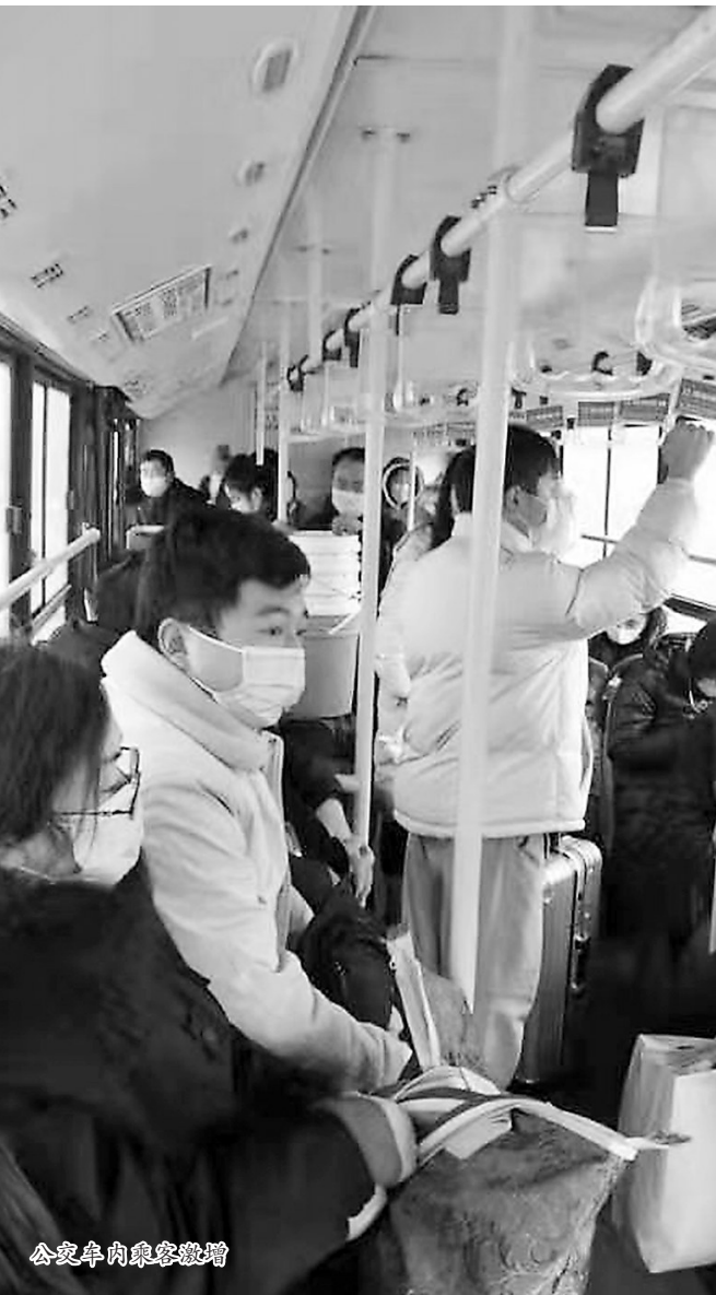
公交车内乘客激增