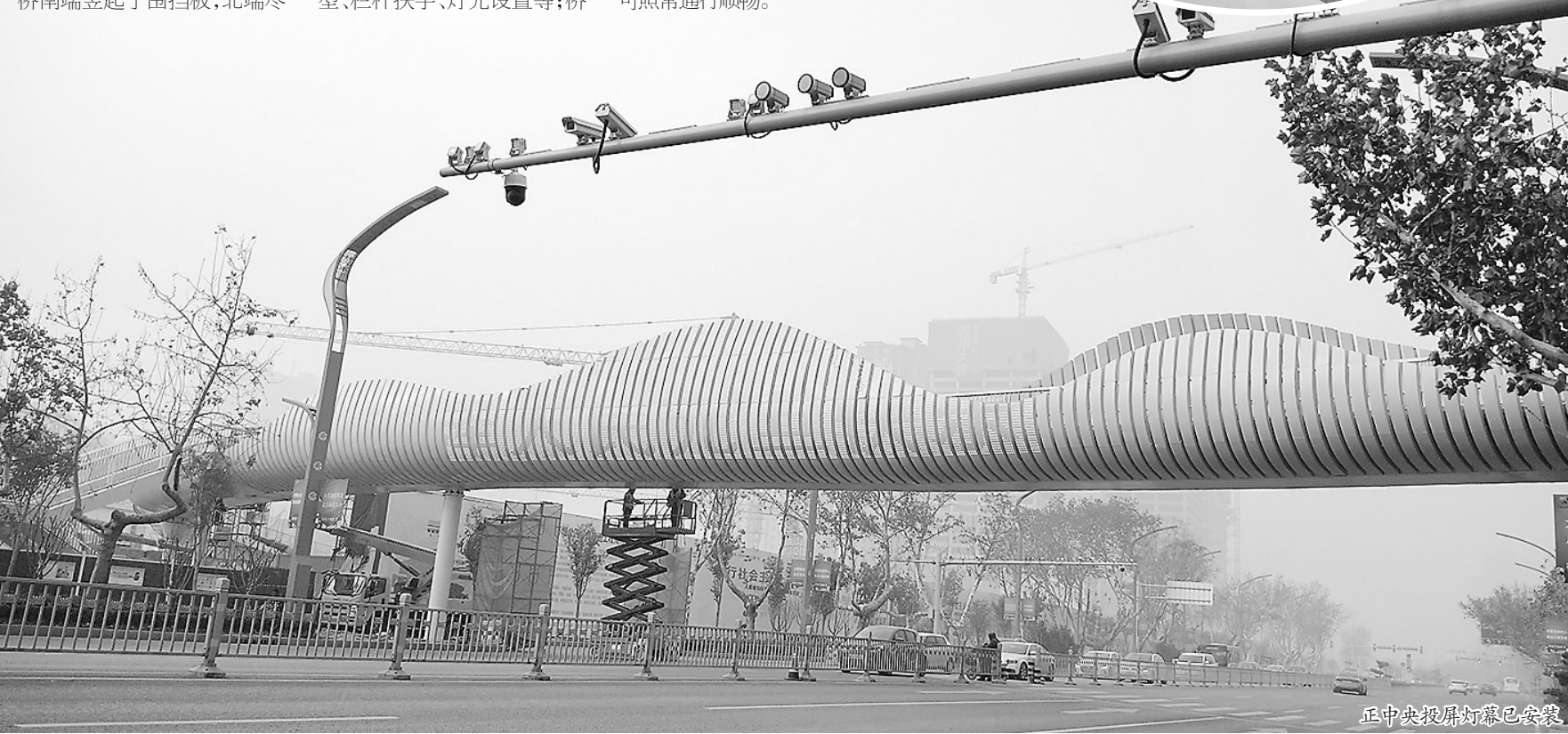
正中央投屏灯幕已安装