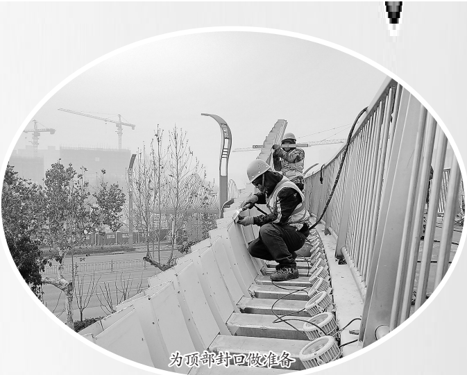
为顶部封回做准备

因周边有居民区,中华西路车流量大,尽量避免施工占道对道路交通的影响。目前,该处景观天桥的施工需要暂时占用中华路辅路,中华路主路可照常通行顺畅。