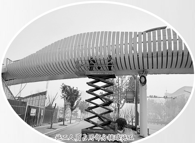
施工人员占用部分辅路施工